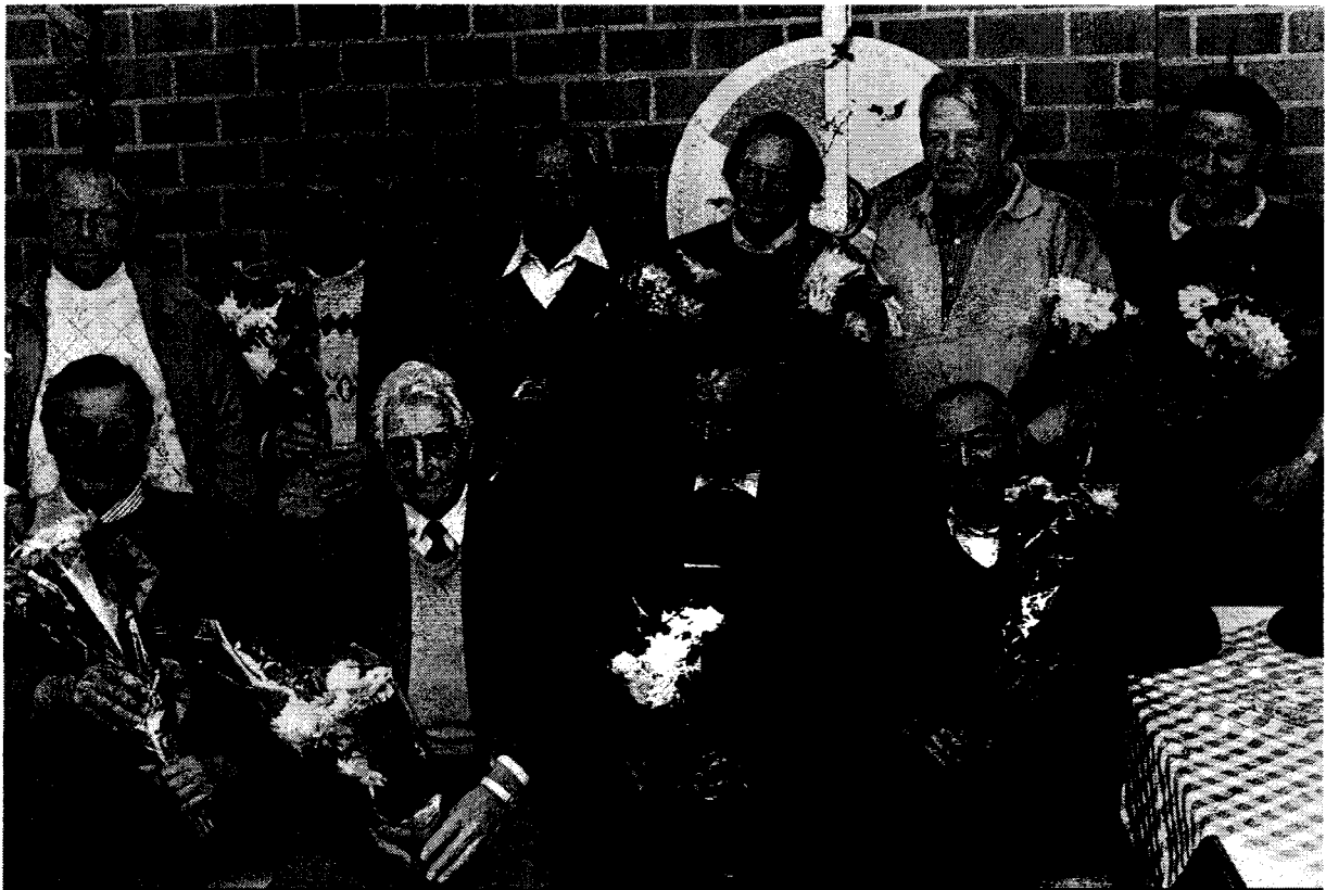
Foto ter gelegenheid van het vijf en twintig jarig bestaan van de Blauwe Doffer